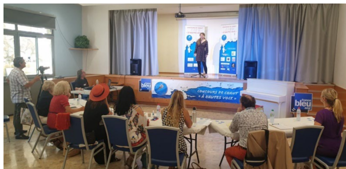
Pré-sélection 2022 à EZE

La finale se tiendra Samedi 18 novembre 2023 à Cap d'Ail